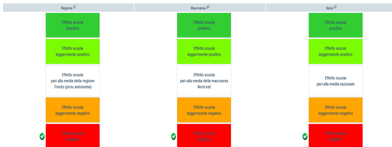
Figura 2. La restituzione dell' effetto scuola

Il risultato del calcolo dell' effetto scuola è restituito in forma grafica (figura 2) su base nazionale, rispetto alla macro-area geografica e alla regione di appartenenza.