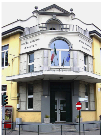
Istituto Comprensivo Statale "Cesare Battisti"